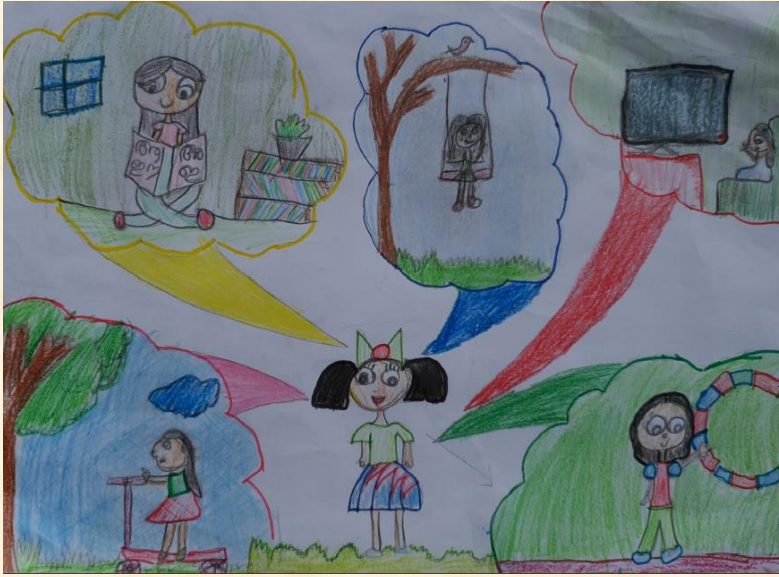
Alhan Aisha Level 1 (winning entry)

The following are the top 3 drawing entries for the competition