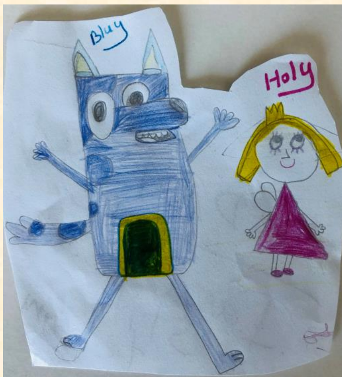
Eva Mohsin Level 2