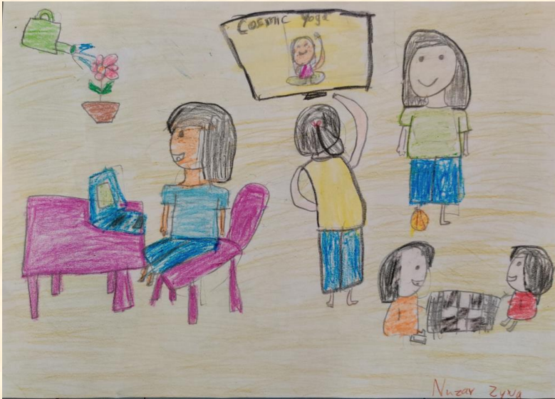
Nuzar Zyva Rikas Level 2